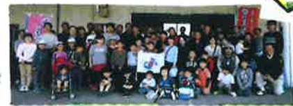
お申し込みはポイントまで!!